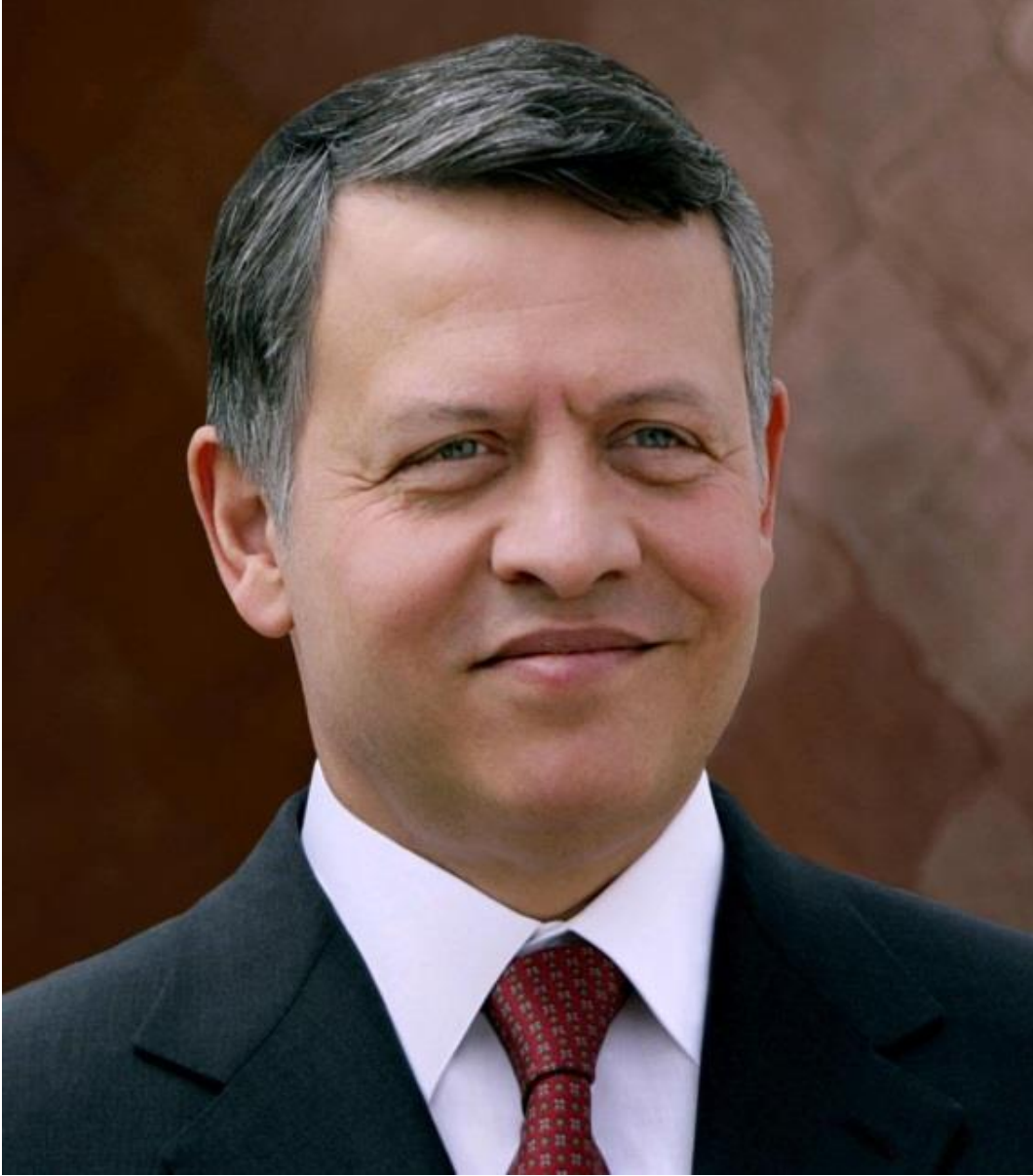
صاحب الجلالة الهاشمية الملك عبدالله الثاني ابن الحسين المعظم