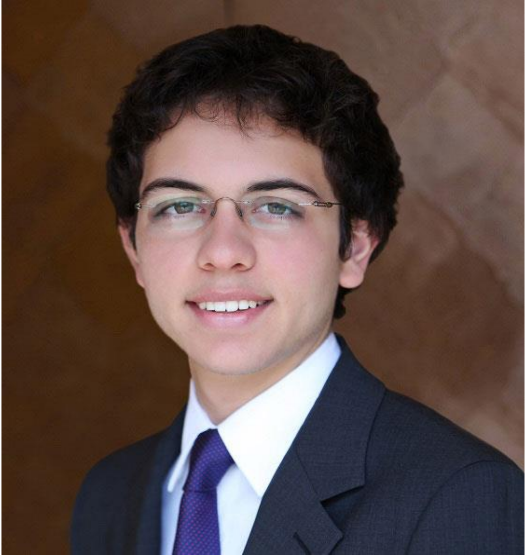
سمو ولي العهد الأمير الحسين بن عبدالله الثاني المعظم